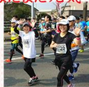
まさかの強行出場