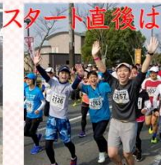
スタート直後はまだまだ元気！！ 美ジョガー