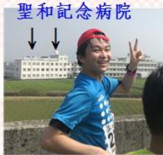
聖和記念病院 ↓ ↓