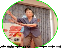
炭坑節を踊ってます♪