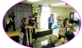
日向ひょっとこ踊り