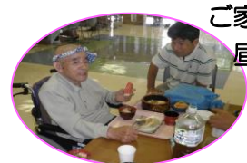
ご家族と一緒に 昼食タイム