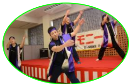
よさこいソーラン節