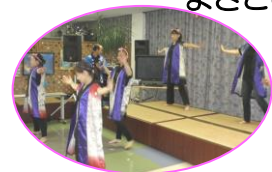
よさこいソーラン節