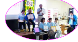
クイズ『この子誰の子?』