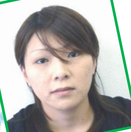
おもやい 丸林主任