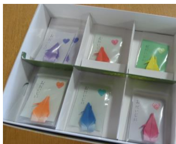
プレゼントの折り鶴