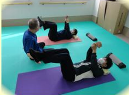
《臥位の状態で体幹トレーニングができるジョイントマット》

シニア向けピラティスは、椅子に座って行うものが多いのですが、通常のピラティスの方法も取り入れており、日常生活動作の基本となる体幹をしっかりと鍛え、転倒予防を図り、毎日を生き生きと過ごして頂けるよう、お手伝いいたしております。