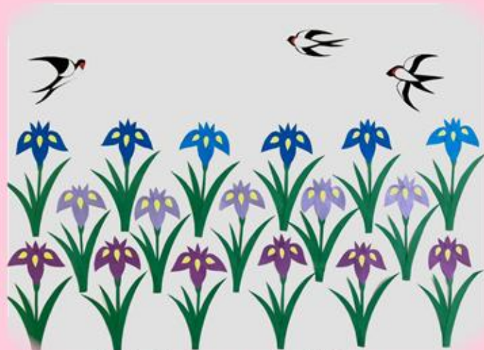
2南病棟 リハビリ作『菖蒲』