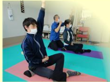
《からだの筋肉が緩み、関節やゆがみを調整するストレッチ》