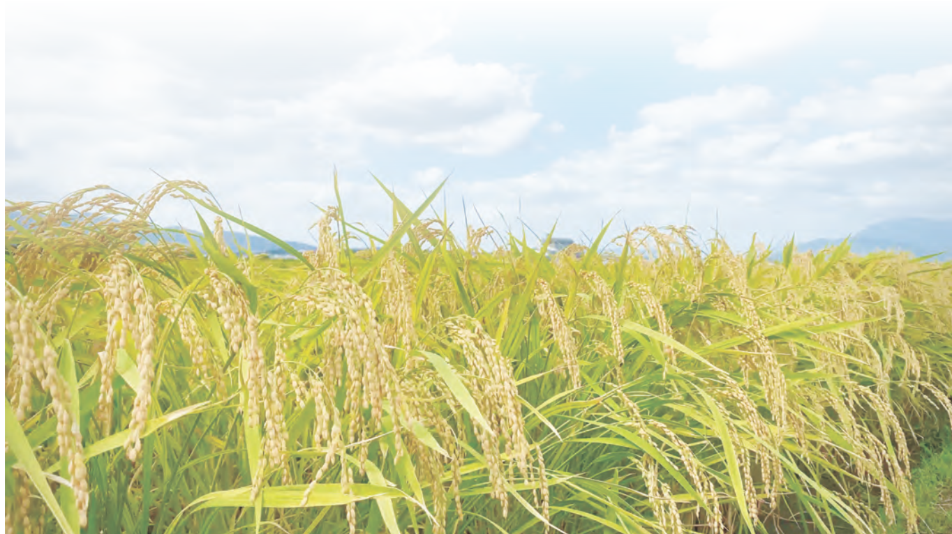
撮影場所：小郡市井上地区

「ひと」と「こと」と「まち」を繋ぎ支えあえる「みらい」を創る ～誰もが自分らしく生きていけるどこよりも温かな地域へ～